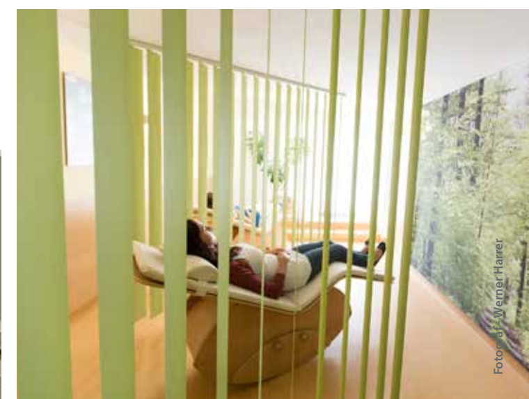
Entspannungsraum für Mitarbeiter im Krankenhaus Linz.