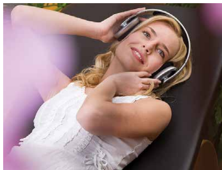
Angenehme Körperwahrnehmung durch Entspannungsmusik