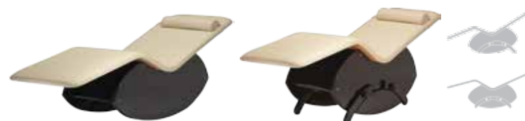
Modell PUR: Schaukelfunktion ohne Fixierbügel