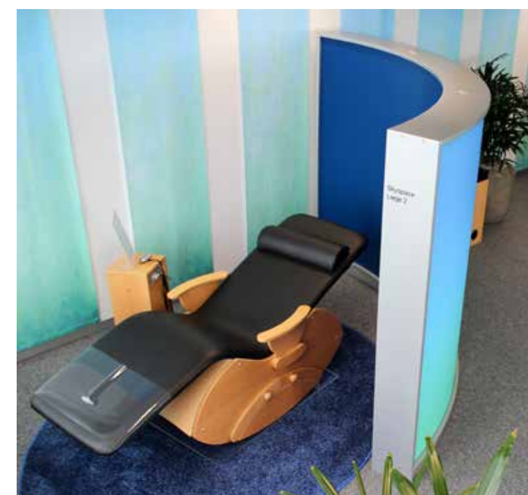
Time-Out-Zone - betrieblicher Regenerationsraum

Allton baut Klang- und Entspannungsmöbel in betriebseigener Tischlerei und bietet in Zusammenarbeit mit kompetenten Partnern auch Unterstützung bei der individuellen Planung und Gestaltung Ihrer Ruhe-, Entspannungs- und Therapieräume.