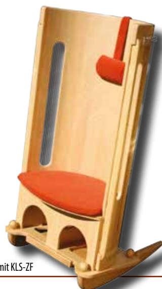
KLSL130 mit KLS-ZF