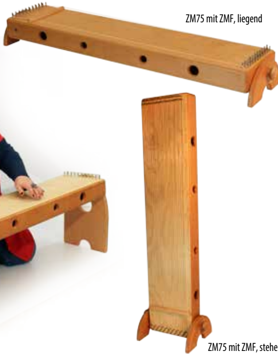
ZM75 mit ZMF, stehend