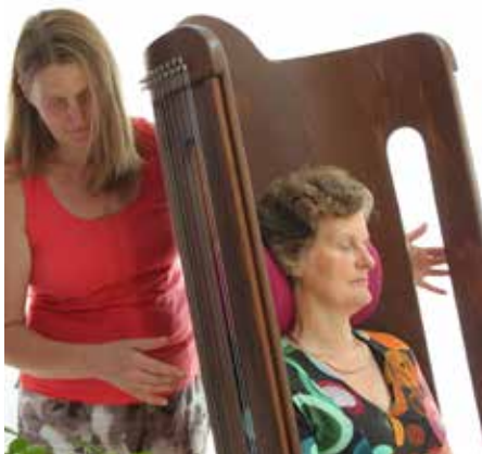
KLSL150, Sonderanfertigung Modell 'Edmonton'