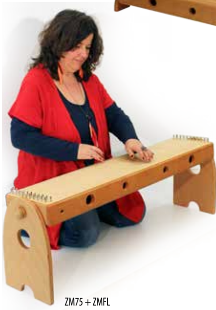
ZM75 + ZMFL