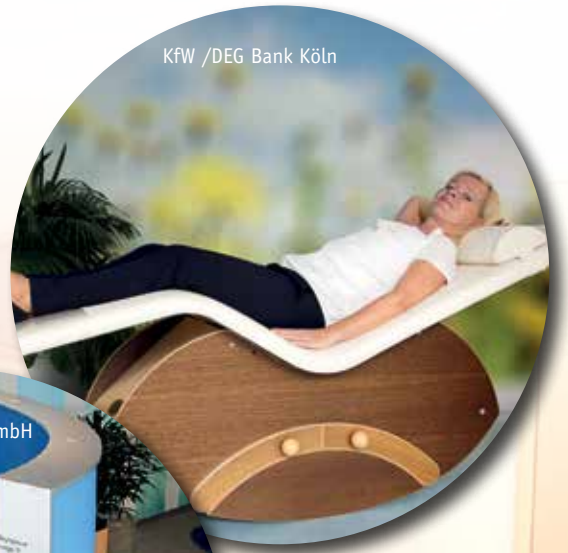
Bosch Engineering GmbH