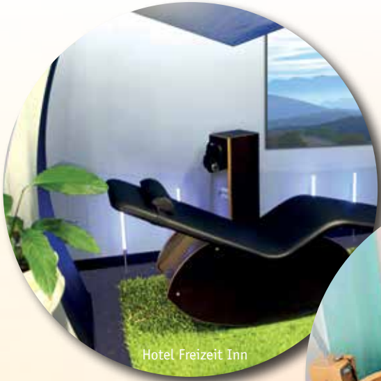
Hotel Freizeit Inn